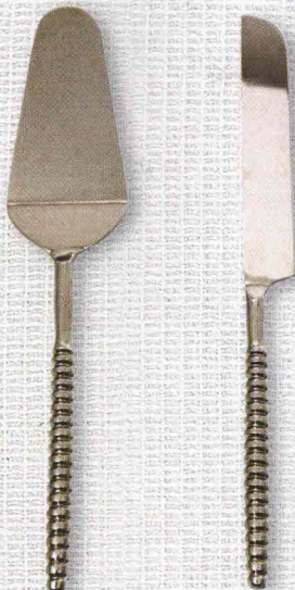
Il set di coltello e paletta in acciaio inossidabile con manico decorato di Chehoma .