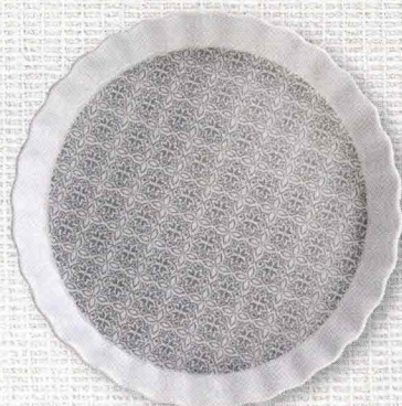
Adatta sia alla mise en place che alla cottura, la forma per crostate di Sandstone riprende i decori delle cementine di una volta.