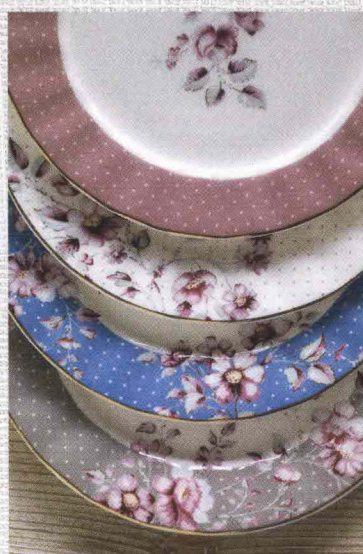
Twist romantico e allure vintage per i piattini floreali con bordo dorato di Creative Tops .