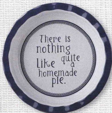
C'è qualcosa di più delizioso che una crostata fatta in casa? No, dice la forma (adatta anche al forno) di Creative Tops .