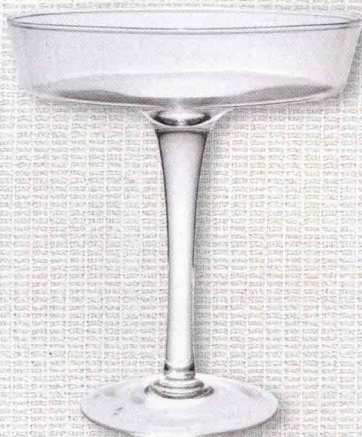
Alzata in vetro di Côté Table per presentare crostate o monoporzioni.